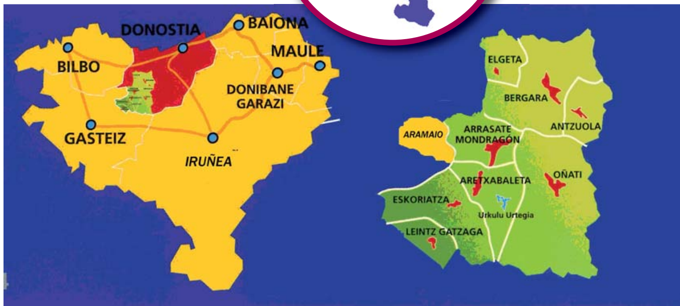
Eskualdeko herrien arteko distantzia (km-tan)