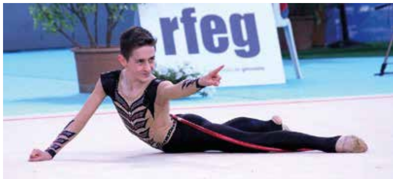
Lambea maila guztietan izan da Espainiako txapelduna

Otsailaren 3an, esan bezala, Zubikoa kiroldegian (16:00-19:00) izango da eta master class bat eskainiko die Aloña Mendiko gimnasta koskortsuenei. Berotze ariketak egin ostean koreografia bat prestatuko dute elkarrekin, atek itxita, eta saioaren amaieran gimnasia taldeko gaztetxoeren aurrean erakutsiko dute landutakoa. Lambeak berak ere egingo omen du erakustalditxo bat.