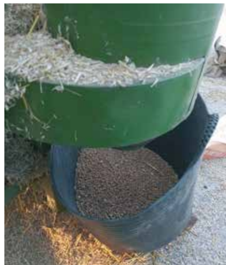
Garia jotzeko makina eta bertatik ateratako gari aleak