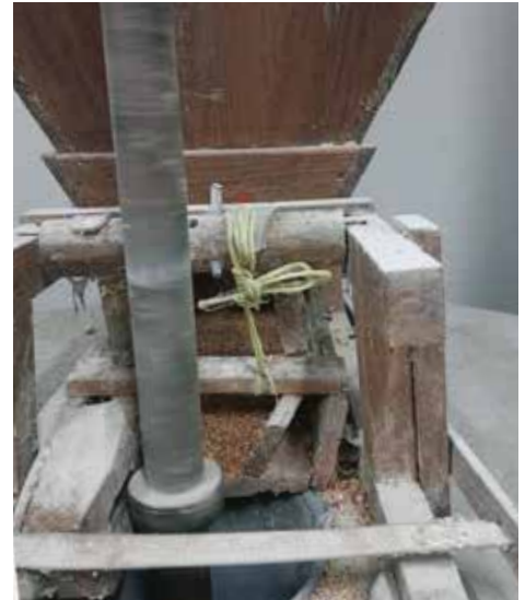
Goian, Olabarrietako errotako irudiak, gari aleak ixoten. Eskuman, Goiko Benta ostatuan egindako dastaketako irudia.