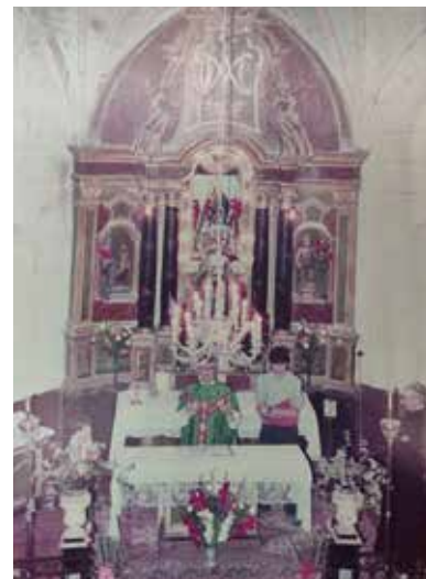
Ezkerrian Urrusulako parrokiako Andramariren irudixa. Eskuman Andramari eguneko Meza Nagusixa

Denpora batian kinttuak edo soldau fan bihar eueiñak izaten ziran organizadore eta preparatibuak egitteko arduria ekuaiñak. Bezperan piñua bota eta harekin eliza ondoko haitzaren onduan musikuandako kioskua gertatu eta inguruak garbiketan zittuain.