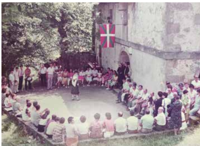
Meza Nagusi osteko aurrezkua

“Andramari egunian goizetik hasitta etorten zittuan auzotarrak, konbidauak eta kanpuan bizi ziran famelixa-tartekuak. Goiz erdi aldera izaten zuan Meza Nagusixa, eta, ostian, soiñujolia eta tertulixia, trago batzuk hartuaz; gero, berriz, bazkeittera konbidauakin batera. Arratsaldian errosarixua eta, gero, erromerixia. Etorten zittuan inguruko auzo danetatik: Araotz osua (Urrusulatik be faten gintzuan Araotzera: gure amandria zuan Araozkua eta aitta be bai. Trinidadetan Araotzera faten gintzuan konbidau, batzuk Gernetara,