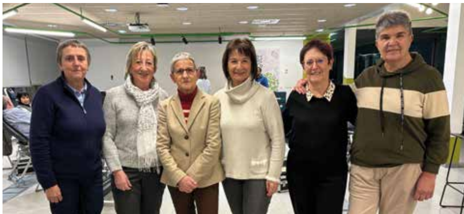
OÑATIKO ODOL EMAILEEN ELKARTEA