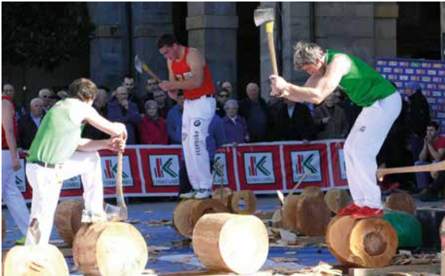
Euria egiten badu, Zubikoa pilotalekuan jokatu da

OTSAILAK 11, IGANDEA, FORUEN PLAZAN, 12:00