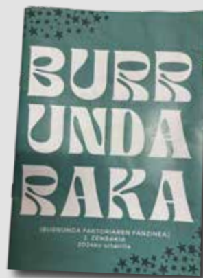
Burrundaraka fanzinearen 2. zenbakia

Bestalde, Burrundaraka fanzinearen 2. zenbakia ere banatuko dute herriko etxeetan. Hurrengo hilabeteetan Oñatira etorriko diren musika talde eta bestelako artistei buruzko informazioa eta herritar ezberdinek egindako gomedioak ere aurkituko ditugu bertan.