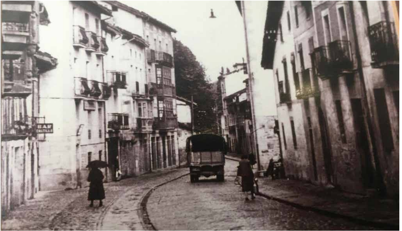
Kale Zaharreko 43an egon zen Castillo taberna, 1957 eta 1980 artean.

▼ Kastillorena izenez ezaguna den etxea berreraikitzen ari dira Kale Zaharrean