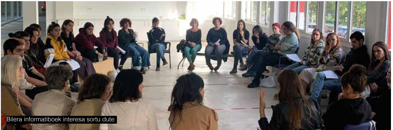
Bilera informatiboek interesa sortu dute

Zaintza bizimodu duina eraikitzeke oinarria da; bizitzako une eta eremu guztietan beharrezkoa. Azaroaren 30ean bizitza duinen alde irtengo gara kalera, guztion bizitza duinen alde.