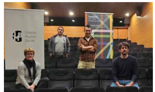
Musika Bandako eta udaleko ordezkariak kontzertu denboraldiaren aurkezpenean

Ekainera bitartean hilean kontzertu bat eskainiko du musika bandak, gai ezberdinen inguruan: Zarzuela, dantza, zirkoa... Publiko desberdina, gaztea (etorkizuneko publikoa) erakartzea da musika bandaren helburuetako bat, eta ildo horretan, aurreko eragile ezberdinak gonbidatuko ditu emanaldietara: musika eskolako ikasleak, gimnasia erritmikako taldea, Potx eta Lotx pailazoak, Gabara abesbatzako bakarlariak... lazko sei kontzertuetatik bitan pilotalekuko aforua (670) bete egin zen, eta beste kontzertuetan 400 entzule bildu ziren, batzuek beste.