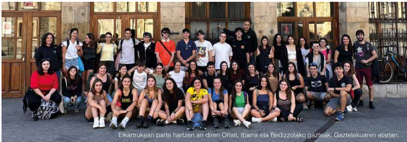
Elkartrukean parte hartzen ari diren Oñati, Ibarra eta Bedizzolako gazteak, Gaztelekuaren atarian