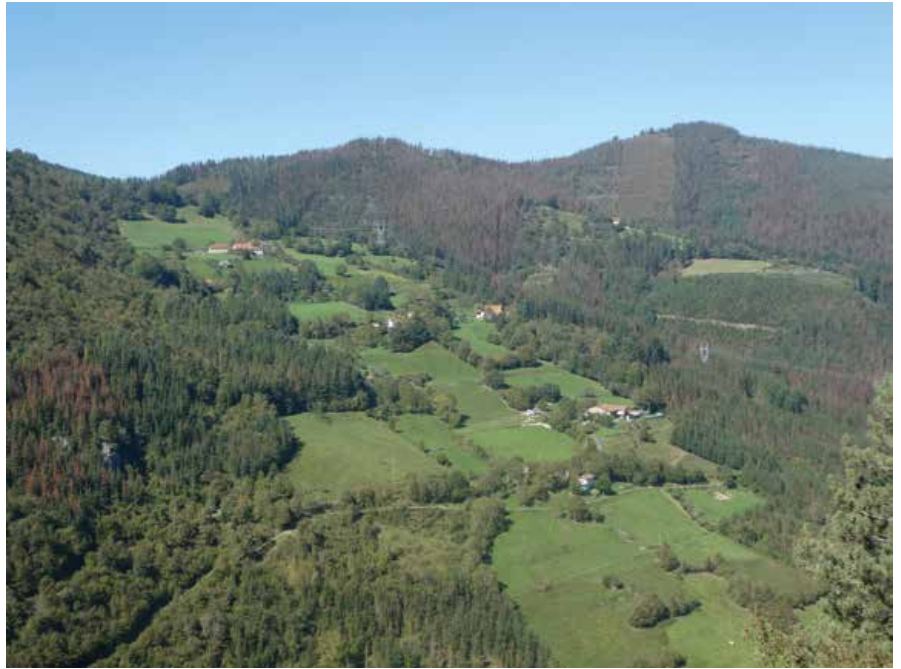
Urrusula auzuaren ikuspegixa

“Urte osorako etxerako lain gari hartzen giñuan eta batzutan gehitxuago be bai, baiña gerra ostian izan zittuan kontuak; entregau egin bihar izaten zuan, eta etxerako geldiketan zana, hau da, etxian bizi ziranen erabera, haxe bakarrik eruan bihar zuan errotara, ezin zuan eruan tokaitten zana baiño gehixago. Papel edo kartilla bat eukitten giñuan eta han ifintten xuan hainbeste kilo aldiko eta zenbat aldiz eruan zeikien deklarauta heukanaren erabera, eta gehixago ezin zuan eruan. Gaiñetikua entregau egin bihar izaten zuan. Errotak prezinttauta eta kontrolauta euki zitxuain. Gure aittak-eta ixoteko makiña txiki bat ekuain, pentsuetarako ebaltzen zana, eta gabaz ixoten euen. Harekin ixo-nahaskilla bat urteten euen.