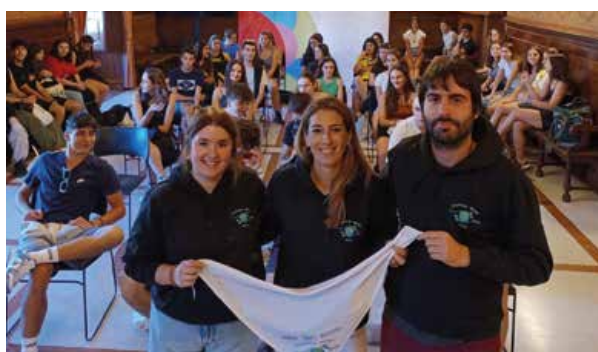
Gazteei udaletxean egindako ongietorriko une bat

Kulturartekotasuna sustatzea helburu duen elkartruke programa batean parte hartzen ari dira Gaztelekuko, Ibarako (Gipuzkoa) eta Bedizzoleko (Italia) hamahiruna gazte