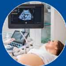
Laguntza Bidezko Ugalketa