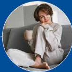
Ginekologia eta Obstetria