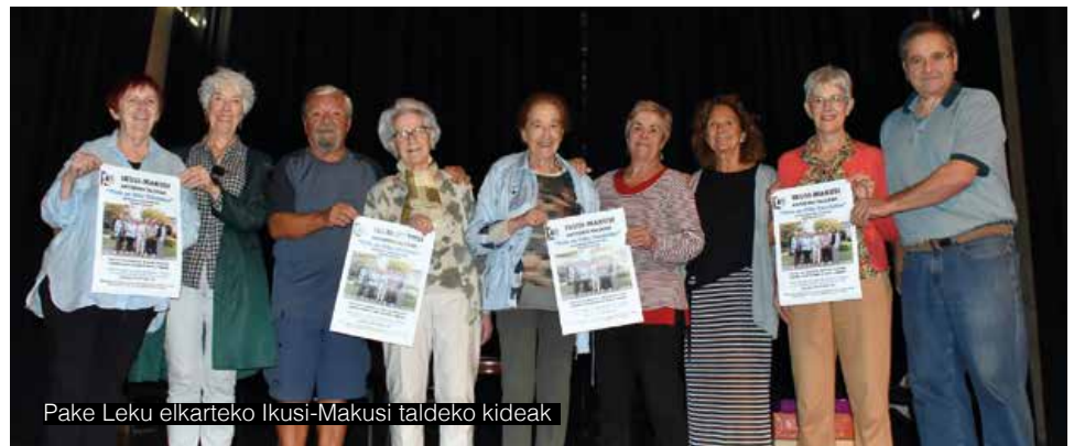
Pake Leku elkarteko Ikusi-Makusi taldeko kideak