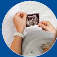
Jaio aurreko diagnostikoa