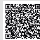
Ondoko QRan ikus daitezke Urkiaren sarrera guztiak

4- LANPERNA IRINTSUA (AMANITA SOLITARIA)