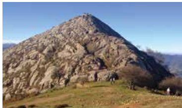
Pico de la Cruz (803m.) mendia

Aloña Mendik azarorako antolatu duen mendi irteera hilaren 19an izango da. Bizkaia aldean egingo dute ibilaldia, Bilbo inguruko meatze-mendietan (Triano mendiak) barrena.