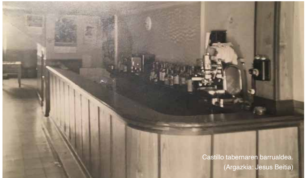
Castillo tabernaren barrualdea.

Arratsaldeko 18:00etatik aurrera taberna 'auzotarrentzat'