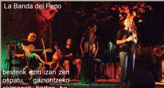
La Banda del Pepo

besterik ezin izan zen ospatu, gainontzeko ekimenak bertan behera geldituz. Trapu Zaharraren antzezlan- na egin egin zen, baina lanbropean. Lastima, baina eguraldia da antolatzaileon eskutatik kanpo gelditzen den faktore bakarra.