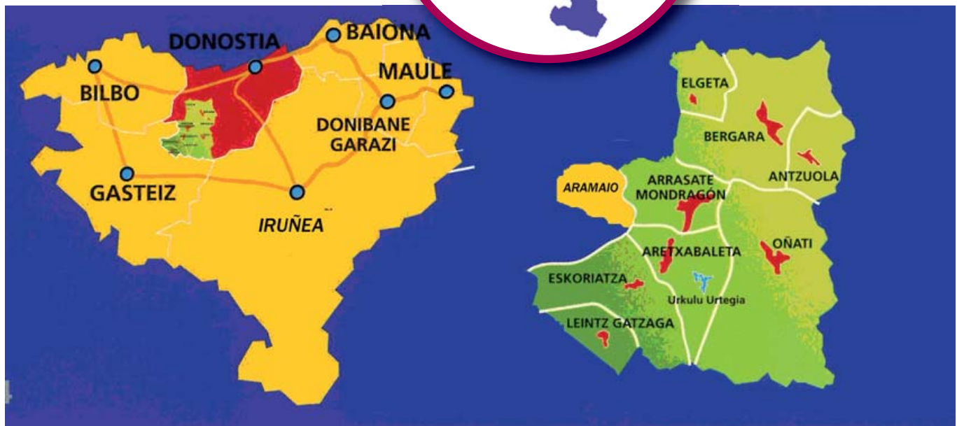
Distancias entre las localidades (en kms)

Gipuzkoa está constituida por diversas comarcas, y una de ellas es la de Debagoiena o Alto Deba; he aquí los municipios que se incluyen en ella (con número de habitantes): Antzuola (2.000); Bergara (15.000); Elgeta (1.000); Oñati (10.700); Arrasate (Mondragon) (22.200); Aramaio (1.400); Aretxabaleta (6.300); Eskoriatza (4.000); Leintz Gatzaga (300).